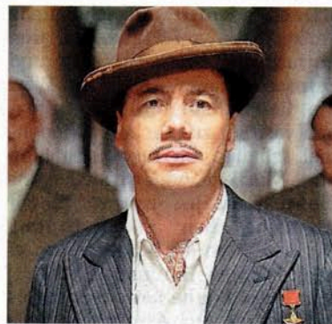
Michael Bully Herbig in „Hotel Lux“