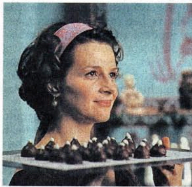
Juliette Binoche in „Chocolat“